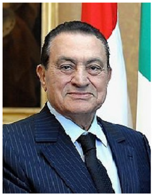
ហួសនី មូបារ៉ាក់ កើត៖ ថ្ងៃទី៤ ខែឧសភា ឆ្នាំ១៩២៨ អាយុ៖ ៨៤ ឆ្នាំ នៅរស ទោស៖ ដែលមានចេតនា សម្លាប់បាតករ ប្រទេស៖ អ៊ីរ៉ង់

២០១១ ទាំងពីរនាក់ត្រូវបានតុលាការសំរេចកាត់ទោសម្នាក់ៗ ៣៥ឆ្នាំ។ ក្រោយមកគេបានទៅ គ្រប់ៗ សំណាក់របស់លោក គេបានរកឃើញទ្រព្យសម្បត្តិ និង មាសពេជ្យជាច្រើននៅក្នុង សំណាក់ប្រធានាធិបតី ប៊ិន អាឡី។ ក្នុងការជាប់ទាក់ទងនឹងទោស តុលាការបានពិន័យ ទឹក ប្រាក់៥០លាន អឺរូ Euro។ គេបានតាមដានហើយនិងរាយ ការណ៍ថា ប្រពន្ធ គាត់បានលួច ឬ បង្វែរមាសទម្ងន់ ១.៥តោន ដែលមានតម្លៃ $៦៥លាន ដុល្លារ ចេញពីធនាគាររដ្ឋ។ ក្រោយមក គេបានរាយការណ៍ថា ចំនួនសមាជិកក្រុមគ្រួសារ របស់ជនជាប់ចោតទាំងពីរ ទាំងអស់៣៣ នាក់ត្រូវបាន ចាប់ខ្លួនជាបន្តបន្ទាប់។ ការវិនិច្ឆ័យទោសត្រូវបានកើតមានភ្លាមនៅពេលដែល លោកទៅដល់ប្រទេស សាវឌី អាហាប់។ របបថ្មីនៃប្រទេសទុយនេស៊ី បានធ្វើបត្យាប័ន ទៅ ប្រទេស សាវឌីអាហាប់ តែប្រទេស សាវឌី អាហាប់ មិនបានបញ្ជូនជនជាប់ចោតទាំងពីរអ្នកនេះ មកវិញទេ។ ដំណឹងប្រព័ន្ធមានចុងក្រោយ គេឮថាលោក ប៊ិន អាឡី ត្រូវរងគ្រោះនិងជម្ងឺដាច់ សរសៃឈាមក្នុងខួរក្បាល ហើយកំពុងព្យាបាលក្នុងមន្ទីរពេទ្យ នៅប្រទេស សាវឌី អាហាប់។