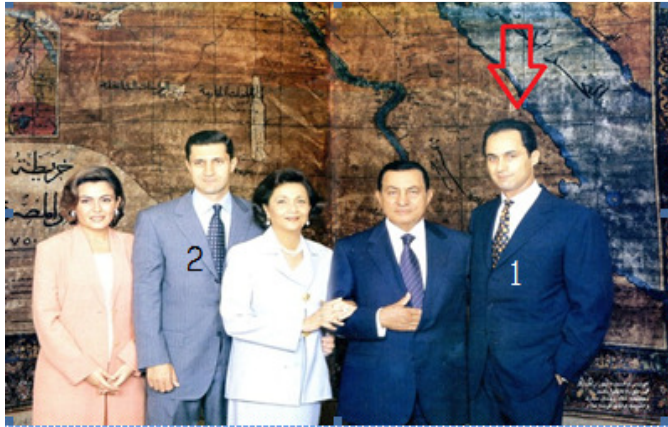
កូនប្រុសទី១៖ Gamal Mubarak កូនប្រុសទី២៖ Alaa Mubarak និង ភិរយា កូនទាំងពីរនេះ មានមហិច្ឆតា ចង់កាន់អំណាច រៀងៗខ្លួនទៅថ្ងៃមុខ។ តែត្រូវបានបញ្ចប់ដោយ បាតុកម្ម។

ខ្ពស់នៃកងទ័ពជាតិ Supreme Council of the Armed Forces ។ ថ្ងៃទី១៣ ខែមេសាសុភាពារបុរស បាន បញ្ជាអោយយាត់ខ្លួន លោក ហួសនី និង កូនប្រុសលោកទាំងពីរ អស់១៥ថ្ងៃ ដើម្បីសួរ អំពី អំពើ ពុករលួយ និង ការប្រើអំណាចហួសកំរិត Abuse of power។ ក្រោយមកគេត្រូវបាន បង្គាប់ អោយគាត់បង្ហាញខ្លួនដោយតុលាការចោតប្រកាន់លោក ទៅនិងបទ មិនយកចិត្ត ទុកដាក់ ទៅលើការបញ្ចប់ បទបាញ់សម្លាប់ទៅលើហ្វូងបាតុករ នៅពេលដែលមានការរើបំរះ ប្រឆាំងនិងលោក នៅថាវៀ ស្វែរ។ ហើយបូកផ្សំនិងការចោតប្រកាន់ទៅលើការធ្វើឃាត អតីត ប្រធានាធិបតី អាន់វ៉ា សាដាត។ នៅថ្ងៃទី២ ខែមិថុនា តុលាការអ៊ីជីប បានសំរេច ដាក់ទោស លោក អោយជាប់គុកមួយជីវិត។ ដំណាលពេលដែលលោក ត្រូវបង្ហាញខ្លួន នៅសាលាក្តី លោកទទួលរងគ្រោះ និងជម្ងឺ ជាប្រចាំ។ ខែកុម្ភៈ ព័ត៌មានរាយការណ៍ថា លោកមានទ្រព្យ សម្បត្តិផ្ទាល់ខ្លួនក្នុងចំនួនទឹកប្រាក់ ពី$៤០-៧០ពាន់លាន ដុល្លារ ដែលជាប់ទាក់ទងទៅក្នុងកិច្ច សន្យា នៅពេលដែលលោក បានបំរើកងទ័ពអាកាស។ ប្រភពកាសែតផ្សេងទៀតបានរាយការ ថា គាត់មានលុយដល់ទៅ $៧០ពាន់លាន ដុល្លារនោះគឺបានមកពីអំពើពុករលួយ។ នៅថ្ងៃទី ១២ ខែកុម្ភៈ ឆ្នាំ២០១១ ប្រទេសស្វីស បានប្រកាស រឹបយកឬ បិទសិទ្ធិ មិនអោយ លោក ហួ សនី និងក្រុមគ្រួសារ មានសិទ្ធិ ដកលុយ ទាំងអស់នោះឡើយ។ សព្វថ្ងៃលោក កំពុងត្រូវបាន ជាប់ឃុំឃាំងទាំងឈ្មោះ និង ឡើងសាលាក្តីទាំងឈ្មោះ។ កូនរបស់លោក ឈ្មោះ កាមាល់ ក៏ត្រូវបាន ចាប់ដែរ អ្នកខ្លះនិយាយថាកាមាល់នេះហើយ ដែលធ្វើអោយចង្រៃ ដល់ឪពុកខ្លួន ដោយបាន យកដំណែង ជាទីប្រឹក្សាផ្ទាល់ របស់លោក ហួសនី។ មិនដឹងជាកាមាល់ ផ្តិតជៀករបៀបម៉េច បានជា នាំគ្រោះមកឪពុក នេះជាសម្តីរបស់កូនគាត់ម្នាក់ទៀត។ រូបកាមាល់ឈរនៅជិតគាត់ ខាងក្រោម។