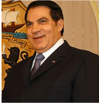
ហ្ស៊ីន អែល អាមីឌីន មិន អាស៊ី កើត៖ ថ្ងៃទី៣ ខែកញ្ញា ឆ្នាំ១៩៣៦ អាយុ៖ ៧៦ ឆ្នាំ នៅរស់ ទោស៖ ជាប់គុក ៣៥ ឆ្នាំ ជាមួយនិង ភិរយា ប្រទេស៖ ទុយនេស៊ី

ក៏ ចាប់ផ្ដើម ក្នុងពេលជាមួយគ្នា ខាងក្រុមបះបោរក៏ចាប់ ផ្ដើមបង្កើតចលនា ដើម្បីប្រឆាំង លោក កាដាហ្វី។ ក្រុមចលនាបង្កើតនៅថ្ងៃទី២៧ ខែកុម្ភៈ ឆ្នាំ២០១១ គេហៅថា Arab Spring។ ពួកប្រឆាំង កាដាហ្វី គណកម្មាការ ក្រុមប្រឹក្សាជាតិដើម្បីផ្លាស់ប្តូរ National Transitional Council ដើម្បីគ្រប់គ្រងលើដីរំដោះ។ មានការសម្លាប់ជាច្រើនដោយរបបលោក កាដាហ្វី។ ដោយមិនចង់ឃើញការសម្លាប់រង្គាល បក្សសម្ព័ន្ធ ដឹកនាំដោយ ណាតូ NATO បានធ្វើអន្តរាគមន៍នៅថ្ងៃទី ២១ ខែ មិនា ដើម្បីបង្ការមិនអោយក្រុម លោកកាដាហ្វី បន្តសម្លាប់មនុស្សតទៅទៀត។ ក្នុងពេលជាមួយគ្នានោះ តុលាការអន្តរជាតិ ICC បានចេញដីការចាប់ខ្លួនលោកនិង បរិវារ របស់គាត់ទាំងអស់ នៅថ្ងៃទី ២៧ ខែមិថុនា។ លោក កាដាហ្វីបានធ្លាក់ចេញពីដំណែង នៅថ្ងៃទី២០ ខែសីហា ឆ្នាំ២០១១។ គាត់បានភៀសសឹកបួគេចខ្លួនចេញពីទីក្រុង ទ្រីពប៉ូលី បន្ត ទៅស្រុកភូមិកំណើតរបស់គាត់ ស៊ីត Sirte។ ទឹកដីស៊ីតនេះហើយដែលគាត់ បានហៅថាជា រដ្ឋានីថ្មីនៃប្រទេសលីប៊ីយ៉ា ហើយបន្តរាយជាមួយពួកចលនាអស់រយៈពេលពីរថ្ងៃ រហូតអស់ ជីវិត។