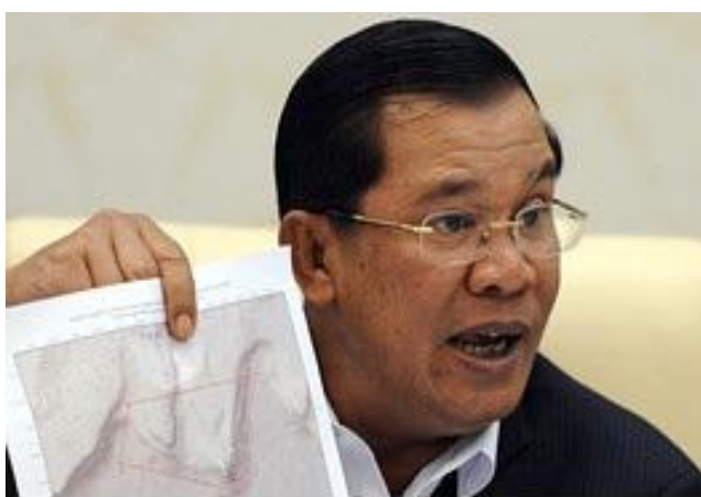
ហ៊ុន សែន ក្បត់ជាតិ

_ សន្ធិសញ្ញាលុបបំបាត់ព្រំដែនជាតិ (Treaty of Delimitation of National Border) នៅថ្ងៃទី២៧ធ្នូ ឆ្នាំ១៩៨៥ រវាងខ្មែរ-យួន ត្រូវបានចុះហត្ថលេខា ដោយរដ្ឋមន្ត្រីក្រសួងការបរទេសវៀតណាមឈ្មោះ លោកវៀងកូថាច់ និងអាមេក្បត់ជាតិយាតករហ៊ុន-សែន អាយ៉ងយួន។ ទោះបីជាផែនការសន្តិភាព សំរាប់ប្រទេសកម្ពុជា រៀបចំឡើងដោយអង្គការសហប្រជាជាតិ និង ប្រទេសមហាអំណាចនានា បានញាំងអោយមានកិច្ចព្រមព្រៀងក្រុងប៉ារីស ថ្ងៃទី២៣ខែតុលាឆ្នាំ១៩៩១ បានផ្តល់ឯកភាព, លទ្ធិប្រជាធិបតេយ្យសេរី, អធិបតេយ្យភាព និងបូរណភាពទឹកដីសំរាប់ប្រទេសកម្ពុជា ដោយបានតម្រូវ អោយលុបបំបាត់នៅរាល់សន្ធិសញ្ញានិងកិច្ចព្រមព្រៀងទាំងឡាយរវាងខ្មែរនិង