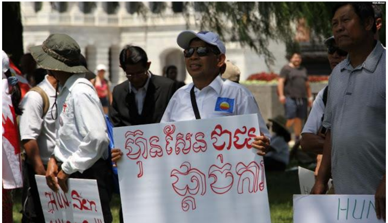
អ្នកចូលរួមម្នាក់កាន់បង្ហាងដែលសរសេរថា «ហ៊ុន សែន ជាជនផ្តាច់ការ» នៅក្នុងការប្រមូលផ្តុំគ្នាមួយនៅក្បែររដ្ឋសភាអាមេរិក រដ្ឋធានី វ៉ាស៊ីនតោន ថ្ងៃទី១៧ ខែកក្កដា ឆ្នាំ២០១៥