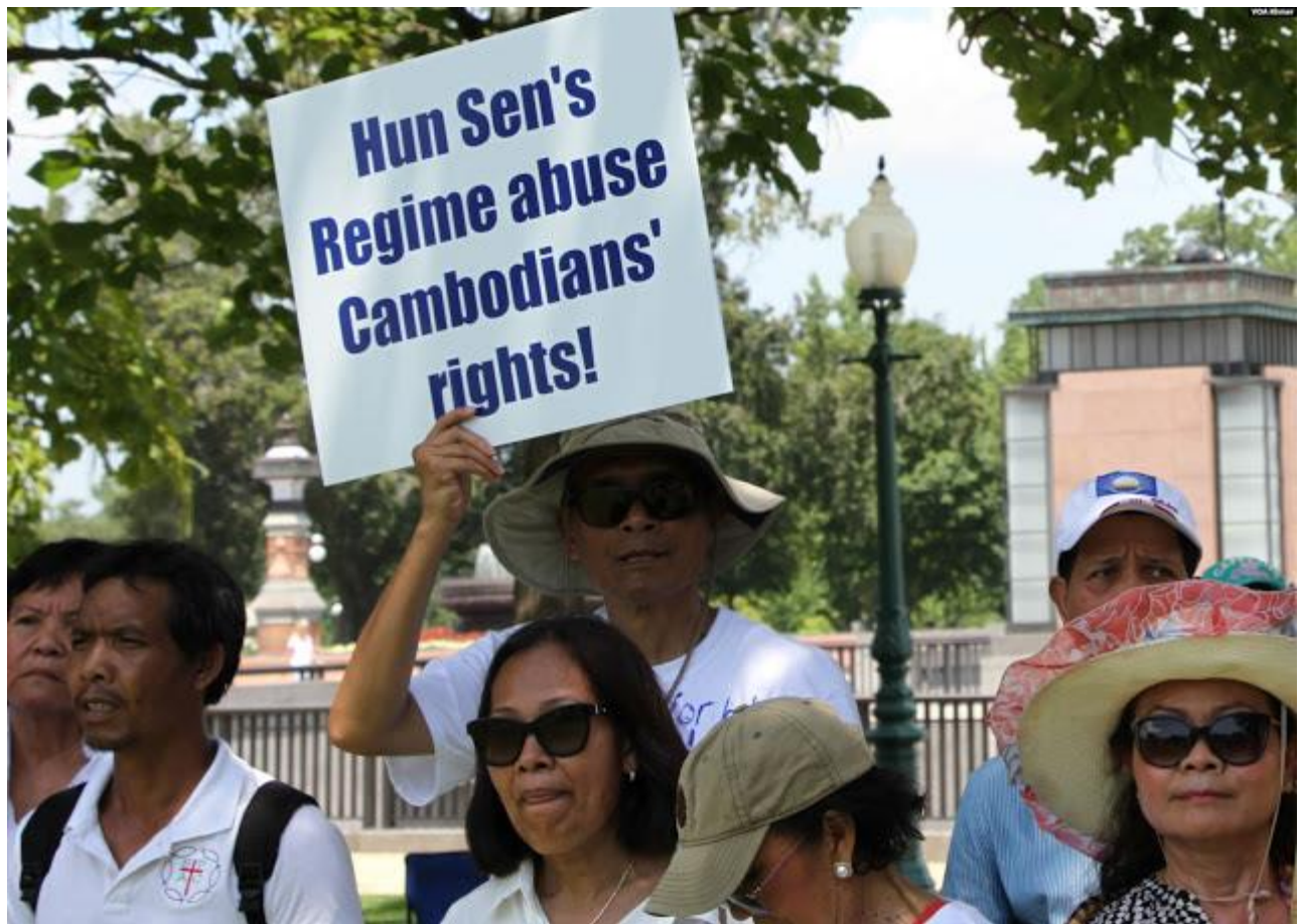
ថ្ងៃទី១៧ ខែកក្កដា ឆ្នាំ២០១៥