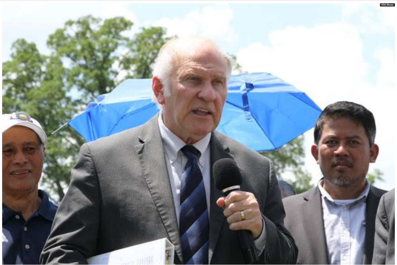
លោក Steve Chabot សមាជិករដ្ឋសភាប្រចាំរដ្ឋ Ohio មកពីគណបក្សសាធារណរដ្ឋ ថ្លែងនៅក្នុងការប្រមូលផ្តុំគ្នាមួយរបស់ពលរដ្ឋខ្មែរនិងអ្នកគាំទ្រគណបក្សសង្គ្រោះជាតិ ដើម្បីទាមទារឱ្យរដ្ឋាភិបាលអាមេរិកជួយស្តារលទ្ធិប្រជាធិបតេយ្យនៅកម្ពុជា រដ្ឋធានីវ៉ាស៊ីនតោន ថ្ងៃទី១៧ ខែកក្កដា ឆ្នាំ២០១៩។