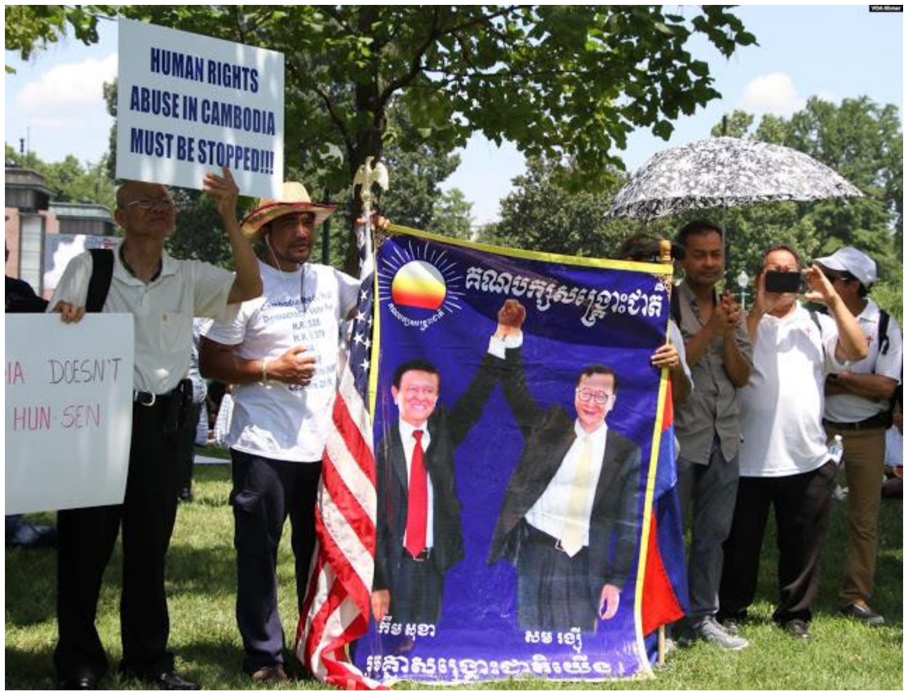
អ្នកចូលរួមកាន់បង្ហាញលោក កឹម សុខា និងលោក សម រង្ស៊ី មេដឹកនាំគណបក្សប្រឆាំង នៅក្នុងការប្រមូលផ្តុំគ្នាមួយ នៅក្បែររដ្ឋសភា អាមេរិក រដ្ឋធានីវ៉ាស៊ីនតោន ថ្ងៃទី១៧ ខែកក្កដា ឆ្នាំ២០១៤។ លោក កឹម សុខា កំពុងត្រូវបានរដ្ឋាភិបាលកម្ពុជាឃុំខ្លួននៅក្នុងគេហដ្ឋាន របស់លោកនៅរាជធានីភ្នំពេញ រីឯលោក សម រង្ស៊ី កំពុងនិរទេសខ្លួនរស់នៅប្រទេសបារាំង។