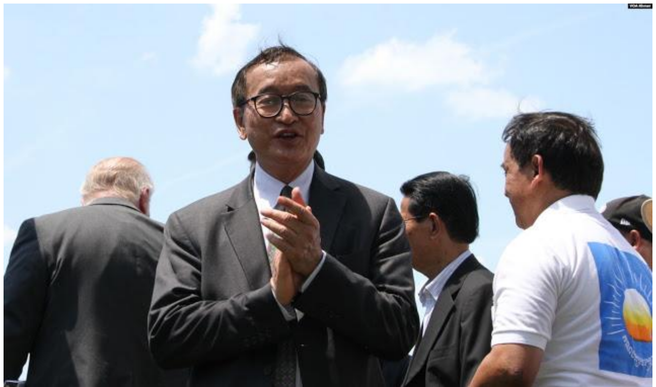
លោក សម រង្ស៊ី ប្រធានគណបក្សប្រឆាំងដែលត្រូវបានគុណការកំពូលវិញ ចូលរួមនៅក្នុងការប្រមូលផ្តុំគ្នាមួយ នៅក្បែររដ្ឋសភាអាមេរិក រដ្ឋធានីវ៉ាស៊ីនតោន ថ្ងៃទី១៧ ខែកក្កដា ឆ្នាំ២០១៩។