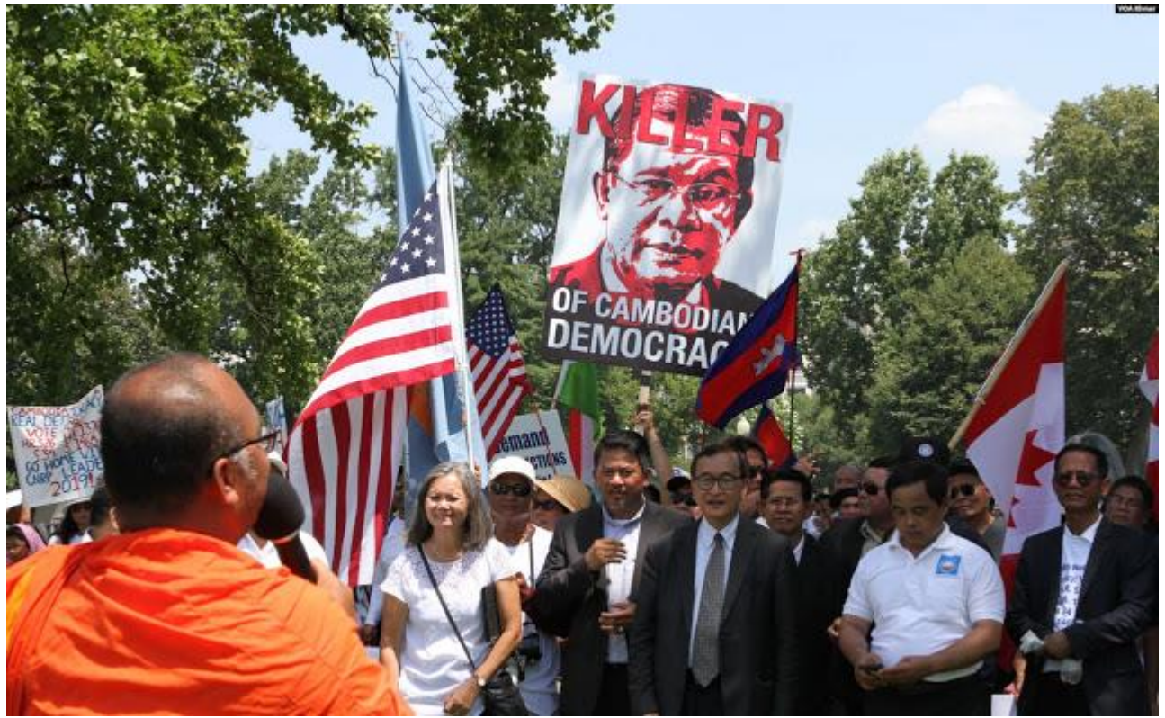
សមាជិកមេដឹកនាំនៃគណបក្សសង្គ្រោះជាតិដែលត្រូវបានគុណការកំពូលរំលាយ ដូបដុំគ្នានៅក្បែររដ្ឋសភាអាមេរិក រដ្ឋធានីវ៉ាស៊ីនតោន ថ្ងៃទី១៧ ខែកក្កដា ឆ្នាំ២០១៤។