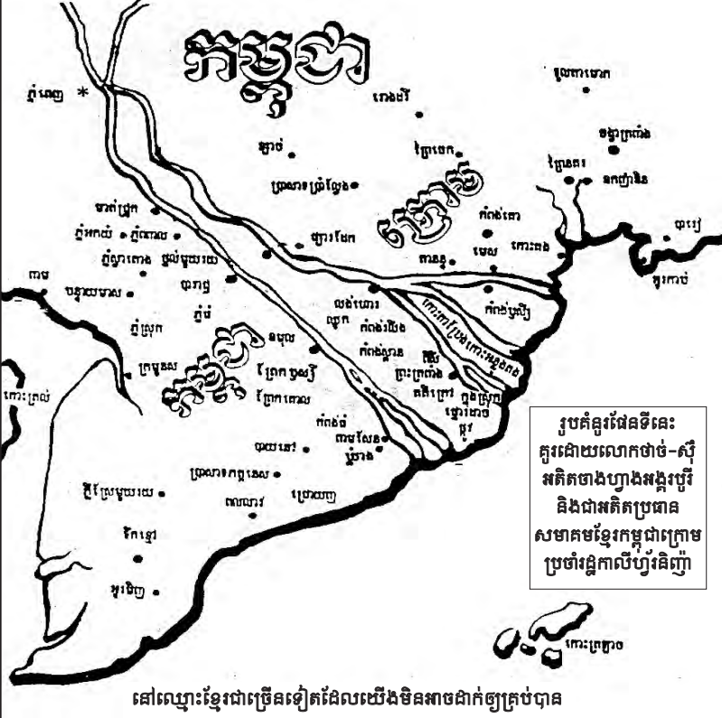
នៅលើខ្មែរជាច្រើនទៀតដែលយើងមិនអាចដាក់ឱ្យគ្រប់បាន

កែវជា Bang Lang កែវជា Bung Sa កែវជា My Than កែវជា Lich Hoi Thuong កែវជា Giang Noi ៧៧