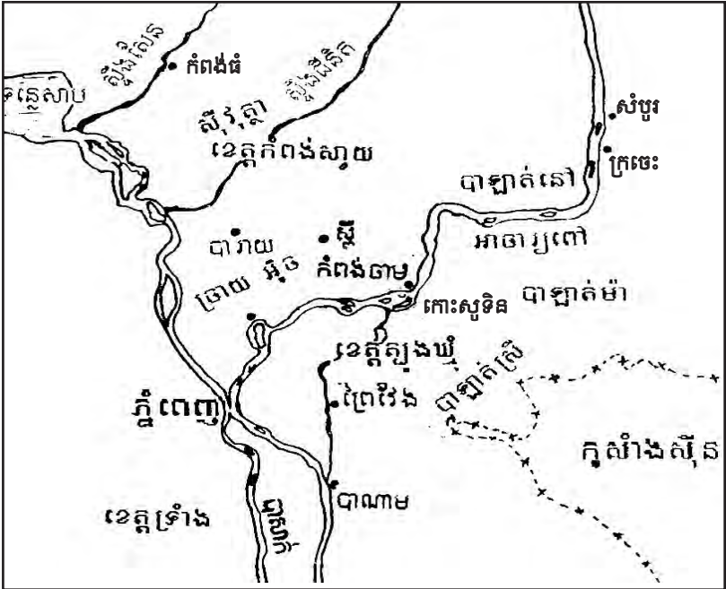
ចលនាតស៊ូនៅខេត្តត្បូងឃ្មុំនិងខេត្តកំពង់ស្វាយ ក្នុងឆ្នាំ១៨៨៥

ដើម្បីជួយដល់ស្ថានភាពសេដ្ឋកិច្ចនៅស្រុកបារាំងអាណានិគមបារាំងបានតម្លើងពន្ធ អាករយ៉ាងធ្ងន់នៅឥណ្ឌូចិន ។ ប្រជាកសិករខ្មែរសម័យនោះក្រីក្រណាស់ ក្នុងមួយឆ្នាំៗ គ្រួសារអាចលក់ស្រូវបានប្រហែល៤០រៀល ឯពន្ធឡើងដល់ទៅ១២រៀល ទៅហើយក្នុងមួយឆ្នាំ ។ កសិករក៏កើតមានការមិនសប្បាយចិត្ត ហើយបានលើក ភ្ជាប់ពាន់នាក់ មកពីតំបន់ខេត្តកំពង់ឆ្នាំ ខេត្តខាងកើតទីក្រុងភ្នំពេញ ចូលមកទូល សុំហ្នឹងស៊ីសុវត្ថិបន្តយពន្ធដារ ។ ព្រឹត្តិការណ៍ជាដំបូងកើតឡើង នៅដើមខែវិច្ឆិកា ១៨១៥ ដោយមានប្រជារាស្ត្រប្រមាណបីរយនាក់ ចូលទៅទាមទារសុំឲ្យហ្នឹងបញ្ចុះ ពន្ធ ។ ក្រោយមកទៀតនៅដើមឆ្នាំ១៨១៦ ការទាមទារបានរាលដាលដល់ខេត្តភាគ ខាងកើតទីក្រុងភ្នំពេញ ដោយមានប្រជារាស្ត្ររាប់ម៉ឺននាក់ ចូលរួមក្នុងក្បួនបាតុកម្ម ដើរចូលមកក្នុងទីក្រុងភ្នំពេញ ។ គេពុំបានស្គាល់មេបាតុកម្មនោះទេ ហើយការទាម ទារនោះក៏មិនទាន់ច្បាស់ថា ធ្វើឡើងដើម្បីប្រឆាំងនឹងបារាំងនៅឡើយដែរ តែគេ សំគាល់ដឹងថា ពួកបាតុករបានពោលថា បារាំងបានធ្វើឲ្យយើងមិនសប្បាយចិត្តជា ខ្លាំងអស់ពេលជាច្រើនឆ្នាំមកហើយ ដោយយកតែមនុស្សអាក្រក់មកធ្វើជាស្តេច សោយរាជ្យ និងមន្ត្រីរាជការ ហើយគំរាមកំហែងសង្កត់សង្កិនធ្វើបាបតែមនុស្ស ល្អ (14) ។