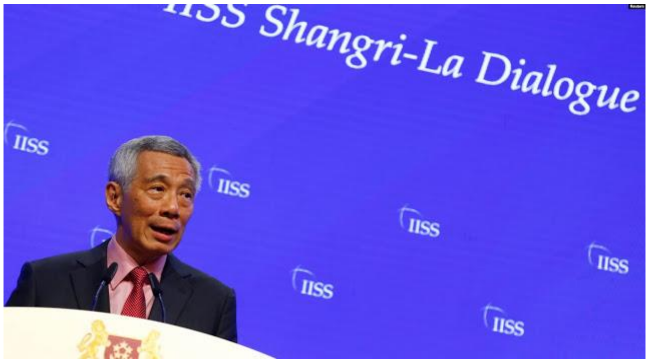
នាយករដ្ឋមន្ត្រីសិង្ហបុរី លោក Lee Hsien Loong ថ្លែងសុន្ទរកថានៅវេទិកាសន្តិសុខអាស៊ី IISS Shangri-la Dialogue នៅសិង្ហបុរីកាលពីថ្ងៃទី៣១ ខែឧសភា ឆ្នាំ២០១៩។