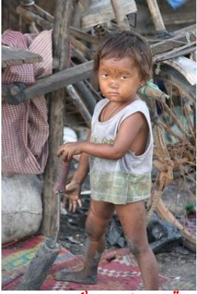
តើអនាគតកូនខ្មែរទៅជាយ៉ាងណា?

ប្រជាពលរដ្ឋខ្មែរចំនួន ៤០ ភាគរយ ស្ថិតនៅក្រោមបន្ទាត់ក្រីក្រ ។ និស្សិតជាច្រើន ដែលបញ្ចប់ការសិក្សា ហើយគ្មានការងារធ្វើ ។ កម្មករប្រាក់ខែតិចមិនគ្រប់គ្រាន់ក្នុងការចំណាយសំរាប់ជីវភាពប្រចាំថ្ងៃ ។ ពួកគេធ្វើការ គ្រាន់តែបំរើនាយទុនរោងចក្រតែប៉ុណ្ណោះ ។ គ្រូបង្រៀនប្រាក់ខែទាបដដែល តែទំនិញនៅលើទីផ្សារ កើនឡើង ជាលំដាប់ ជាពិសេស សាំង ដែលធ្វើអោយប៉ះពាល់ដល់ជីវភាពប្រជាពលរដ្ឋយ៉ាងខ្លាំង ព្រោះកាលទំនិញឡើងថ្លៃ ប្រាក់ខែដដែលធ្វើអោយចំណាយច្រើនជាងចំណូល ប្រាក់សន្សំទាប ( ក្រីក្រ ) ។ ប្រជាពលរដ្ឋខ្មែរចំនួន ៨៥ ភាគរយ ជាកសិករក្រីក្រមុខរបរកសិកម្ម ។ មុខរបរចិញ្ចឹមជីវិតពួកគាត់អាស្រ័យលើដីស្រែ ដីចំការ ដើម្បីចិញ្ចឹមជីវិត តែឥឡូវនេះ ដីស្រែដីចំការរបស់គាត់មួយចំនួន ត្រូវបានយួនដល់ក្លែងភេទជាខ្មែរ និងបក្សពួក ហ៊ុន សែន ប្រើប្រាស់ជារូបភាពក្រុមហ៊ុនដណ្តើមដីស្រែដីចំការរបស់គាត់អស់ តើអនាគតវាសនាកូនចៅគាត់ដែលជាខ្មែរទៅ ជាយ៉ាងណា? កូនចៅក្រីក្រ មិនបានរៀនសូត្រ ហើយអស់ដីស្រែដីចំការទៀត ។ តាមសម្បត្តិធនធានរបស់ខ្មែរ ដែលមានដូចជាចំណូលបានពីទេសចរណ៍ ប្រាសាទអង្គរវត្ត វិរិយាស ពេជ្រត្បូង ព្រៃឈើ ជាដើម ធ្វើបទល្មើសនិង ប្រជាពលរដ្ឋខ្មែរប្រមាណជាង ១០ លាននាក់នោះ ប្រជាពលរដ្ឋខ្មែរមិនគួរក្រីក្រដើរសុំទានគេនោះឡើយ ។ តើធនធានទាំងអស់នោះ ធ្លាក់ទៅដល់ដៃអ្នកណា? ទ្រព្យសម្បត្តិរបស់ខ្មែរ ផលប្រយោជន៍ខ្មែរ ត្រូវធ្លាក់លើ ពួកជនពុករលួយគណបក្សប្រជាជនកម្ពុជានេះឯង ដែលគេងប្រវ័ញ្ចយកទៅដាក់ផលប្រយោជន៍ផ្ទាល់ខ្លួន ។ យួន រឹបអូសយកទៅបំរើផលប្រយោជន៍ជាតិ និងប្រទេសរបស់គេ ។