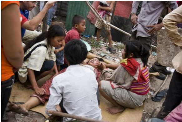
ការរឹបអូសយកដីប្រជាពលរដ្ឋក្រោមរូបភាពក្រុមហ៊ុន និង អភិវឌ្ឍន៍

ក្រុមហ៊ុន ជាការបិទបាំង ចំណែកឯពួកអាយ៉ង យកពាក្យថា អភិវឌ្ឍន៍ មកធ្វើជាលេស ដើម្បីបំពេញមហិច្ឆតា របស់យួន ដែលចង់លេបទឹកដីខ្មែរ ដូចកាលដែលយួនបានធ្វើនៅក្នុងទឹកដីខ្មែរកម្ពុជាក្រោមដែរ។ បញ្ហានេះ បាននឹងកំពុងកើតឡើងជាបន្តបន្ទាប់នៅក្នុងប្រទេសខ្មែរ។ ពួកអាជ្ញាធរផ្តាច់ការ ហ៊ុន សែន បានប្រគល់ដីសម្បទាន អោយក្រុមហ៊ុន យួនមានរយៈពេលយ៉ាងតិច ៩៩ឆ្នាំ។ ពួកនេះរឹបអូសយកដីប្រជាពលរដ្ឋ ដែលការរឹបអូសដីនេះ បានប៉ះពាល់យ៉ាងធ្ងន់ធ្ងរដល់ជីវភាពប្រជាពលរដ្ឋខ្មែរសព្វថ្ងៃ។ ដូចក្នុងករណីថ្មីៗនេះ នៅភូមិសំបុកចាប នៅភូមិដី ក្រហម សហគមន៍វិកាយ និងនៅតាមបណ្តាខេត្តផ្សេងៗទៀតជាច្រើន។ ចូរយើងនាំគ្នាពិចារណាមើលទៅ ការផ្តល់សម្បទានដីដែលមានរយៈពេល ៩៩ឆ្នាំ ទៅអោយយួន តើអនាគតទឹកដីខ្មែរអាចក្លាយជាកម្មសិទ្ធិ របស់យួនបានឬទេ បើសិនជាជីវិតមធ្យមរបស់ខ្មែររស់បានត្រឹមតែ ៥០ឆ្នាំនោះ។ ចំណែកការបិទសិទ្ធិសេរីភាពខ្មែរ ការបំភ្លៃលុបបំបាត់ប្រវត្តិសាស្ត្រខ្មែរពិតប្រាកដ គេធ្វើកែប្រែជាបន្តបន្ទាប់។ ជាពិសេស នៅពេលឥឡូវនេះ ជនអន្តោប្រវេសន៍យួនរស់នៅយ៉ាងច្រើនកុះករនៅ លើកទឹកដីខ្មែរសព្វថ្ងៃនេះទៀត ។