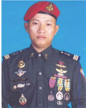
ចារកម្មយួន ក្នុងភេទជាខ្មែរ

ជនអន្តោប្រវេសន៍ទាំងអស់ត្រូវគោរពតាមច្បាប់អន្តោប្រវេសន៍ និងគោរពច្បាប់របស់ប្រទេសខ្មែរ ។ ចំពោះជនអន្តោប្រវេសន៍ដែលមិនគោរពច្បាប់របស់ខ្មែរ ត្រូវបញ្ជូនត្រឡប់ទៅប្រទេសកំណើតវិញ ។ ចំពោះជនអន្តោប្រវេសន៍ដែលមានសញ្ជាតិខ្មែរ ដែលមានលក្ខណៈពេញលេញជាជនជាតិខ្មែរ មានសិទ្ធិស្មើគ្នានឹងពលរដ្ឋខ្មែរទូទៅដែរ ។ គ្រប់ភ្នាក់ងារទាំងអស់របស់យួនទាំងស៊ីវិល និង យោធា ត្រូវបញ្ជូនត្រឡប់ទៅប្រទេសដើមវិញ ។