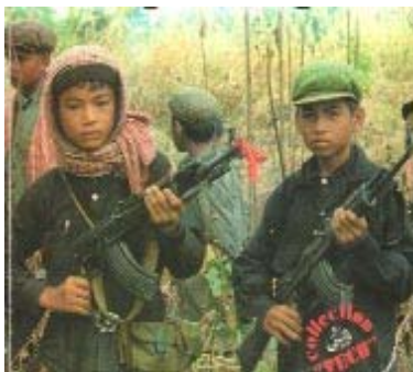
កូនខ្មែរដែលយួនកុម្មុយនិស្ត បំពាក់បំប៉នមនោគមន៍កុម្មុយនិស្ត អោយសម្លាប់ខ្មែរ