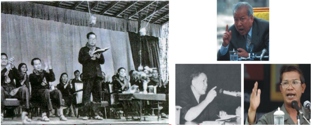
បើចង់រកយុត្តិធម៌អោយខ្មែរ ត្រូវកាត់ទោស ប៉ុល ពត សីហនុ ហ៊ុន សែន និងយួន ដែរ

អង្គការសហប្រជាជាតិដែលចង់រកយុត្តិធម៌អោយប្រជាពលរដ្ឋខ្មែរ និងចង់បំបាត់និទន្តភាពបានចំណាយ លុយជាច្រើនមកអោយពួកជនពុករលួយ។ ដើម្បីយុត្តិធម៌សំរាប់ជនរងគ្រោះខ្មែរ សូមអោយអង្គការសហប្រជា ជាតិ បញ្ចេញអោយអស់សមត្ថភាព ដើម្បីសំរេចនូវកិច្ចការជាប្រវត្តិសាស្ត្រនេះ។