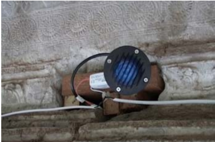
យួន សុខ គង់ ដាប់ថ្នូរប្រាសាទអង្គរវត្ត បំផ្លាញអច្ឆរិយវត្ថុខ្មែរ