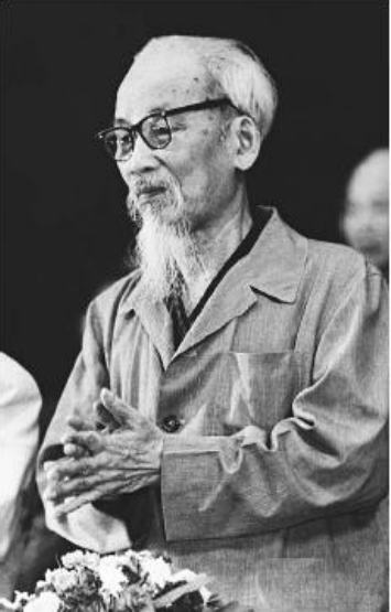
មេដឹកនាំយួន ឈ្មោះ ហ្វៀង អៃកុក (ហូ ជីមិញ)

ក្នុងដំណាក់កាលដែលប្រទេសទាំងបី ខ្មែរ យៀកណាម ឡាវ នៅក្រោមអាណានិគមបារាំង ដោយមានជំនួយពីបក្សកុម្មុយនិស្តចិន គូមីងតាំង និងស្របពេលដែល ហូ ជីមិញ បានចូលជាសមាជិកបក្សកុម្មុយនិស្តអន្តរជាតិ យួនបានរៀបចំធ្វើបដិវត្តន៍មួយដើម្បីដេញបារាំងចេញពីទឹកដីឥណ្ឌូចិន។ យួនបានយកលទ្ធិកុម្មុយនិស្តជាមធ្យោបាយ អំពាវនាវអោយប្រជាជនក្នុងតំបន់ចូលរួមតស៊ូដេញបារាំងចេញពីទឹកដីឥណ្ឌូចិន ដើម្បីប្រទេសទទួលបានឯករាជ្យ។ សូមបញ្ជាក់ថា មនោគមន៍កុម្មុយនិស្តដែលយួនបណ្តុះបណ្តាលខ្មែរនោះ គឺជាមនោគមន៍កុម្មុយនិស្តខុសទិសសំរាប់បំរើនយោបាយអោយយួនប៉ុណ្ណោះ។ ការធ្វើដូចនេះ ព្រោះយួនចង់រំលើងជាតិខ្មែរអោយខ្សោយ ដូចជានៅក្នុងរបប ប៉ុល ពត ដើម្បីលេបយកទឹកដីខ្មែរ។ យួនកុម្មុយនិស្តបានចូលមកបញ្ចុះបញ្ចូលខ្មែរជាសម្ងាត់នៅក្នុងទឹកដីខ្មែរ បណ្តុះបណ្តាលខ្មែរនៅក្នុងទឹកដីខ្មែរ ដើម្បីអោយខ្មែរចូលជាសមាជិកបក្សកុម្មុយនិស្តយួនចាប់តាំងពីឆ្នាំ១៩៤៦ ។ ក្រោយមក យួនបានចាប់កូនខ្មែរចំនួន ៣ ៥០០ នាក់ ទៅ ៤ ០០០ នាក់ យកទៅបណ្តុះបណ្តាលមនោគមន៍វិជ្ជាកុម្មុយនិស្តនៅទីក្រុងហាណូយ។ ពួកក្មេងខ្មែរទាំងនោះនៅក្មេងខ្ចីខាងប្រវត្តិសាស្ត្រ និងនយោបាយ ធ្វើអោយខ្មែរទាំងនោះលង់ក្នុងមនោគមន៍កុម្មុយនិស្តយួន ហើយបំរើនយោបាយអោយក្រុងហាណូយ កៀបសង្កត់ជិះជាន់ជាតិឯងជាបន្តបន្ទាប់មករហូតដល់សព្វថ្ងៃ។