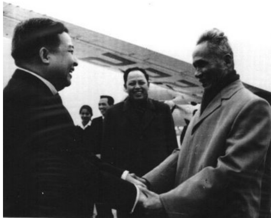
សីហនុ ជាមេខ្មែរក្រហម បំរើនយោបាយអោយពួកកុម្មុយនិស្ត យួន និង ចិន

ចំណែកឯ សា ឡុតសរ ដែលទទួលបានអាហាររូបករណ៍ទៅសិក្សាប្រទេសបារាំងផ្នែកអគ្គិសនីបានចាប់ អារម្មណ៍រឿងនយោបាយ ហើយបានអានសៀវភៅកុម្មុយនិស្ត(សៀវភៅក្រហម)នៅប្រទេសបារាំង។ ដំបូង ឡើយ សា ឡុតសរ បានដឹកនាំធ្វើការតស៊ូប្រឆាំង និងការដឹកនាំរបបសក្តិភូមិរបស់ នរោត្តម សី ហនុ តាំងពី គាត់កំពុងសិក្សានៅប្រទេសបារាំង ក្រោយមកស្តេច នរោត្តម សីហនុ បានកាត់ផ្តាច់អាហាររូបករណ៍វិញ ដោយគាត់ មិនទាន់រៀនចប់ផង ក៏ត្រឡប់មកប្រទេសខ្មែរវិញ។ ក្រោយពេលដែលគាត់មកដល់ប្រទេសខ្មែរ ដោយការមិន ពេញចិត្តនឹងរបបសក្តិភូមិ ដឹកនាំដោយ សីហនុ គាត់បានរៀបចំធ្វើនយោបាយបដិវត្តន៍នៅក្នុងប្រទេសខ្មែរ ហើយ ផែនការបានបែកដឹងដល់អាជ្ញាធរ សីហនុ ទើប សីហនុ បានប្រកាសដេញចាប់ សា ឡុតសរ និងអ្នកចូលរួម ក្នុងកិច្ចការនេះមួយចំនួនទៀត មានចំនួន ៦៣ នាក់ក្នុងនោះមាន សុន សេន ដែរ។ ពេលនោះ សា ឡុតសរ បានរត់ចូលព្រៃហើយបានចូលទៅធ្វើជាលេខារបស់ ទូ សាមុត ដែលដឹកនាំដោយ ស៊ីង ដុកមិញ។ យើងឃើញថា យួនបានជួយខ្មែរក្រហមអោយប្រឆាំង និងនរោត្តម សីហនុ